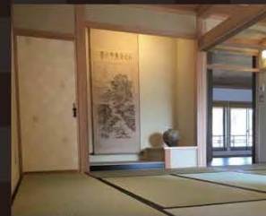
▲会議室2(和室) 定員/16名 旅館の客室の雰囲気を残す和室