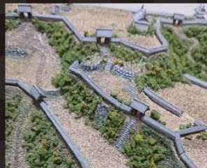
▲歴史展示コーナーでは笠間城をメインテーマとしており、絵図や復元模型のほか、パネル展示などで笠間城の歴史や昔の姿を紹介。