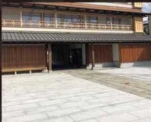
▲交流広場1,2 ひさぎ 寛家により生まれた憩いのスペース